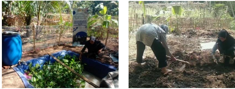
Gambar 3. Sosialisasi dan Pembuatan instalasi penyaringan limbah cair tahu

Kegiatan sosialisasi bahaya limbah dan pengelolaan limbah cair tahu dilaksanakan setelah tong filtrasi dan kolam biofilter sudah selesai dibuat. Kegiatan sosialisasi ini bertujuan untuk menjelaskan kepada masyarakat mengenai dampak limbah yang tidak terkelola dengan baik pada lingkungan. Kegiatan dilaksanakan dengan metode ceramah dan diskusi interaktif. Pada saat sebelum dan sesudah sosialisasi, diberikan kuesioner untuk mengukur pemahaman masyarakat mitra tentang materi yang diberikan. Setelah dilakukan penyuluhan untuk memperkuat pengetahuan dan pemahaman mitra tentang dampak limbah, mitra ditunjukkan mengenai metode pengelolaan limbah dengan grey water system yang telah dibuat sebelumnya. Kegiatan penyuluhan dapat dilihat pada Gambar 4.