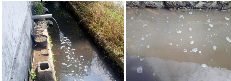
Gambar 2. Pembuangan limbah industri tahu yang dilakukan oleh masyarakat dusun curah mluwo

Wilayah Dusun Curah Mluwo, Kecamatan Rambipuji, Kabupaten Jember terdapat home industry tahu yang membuang limbah cair tahu ke aliran sungai. Limbah tersebut memiliki warna, busa, endapan, dan bau yang sangat menyengat sehingga menimbulkan pencemaran air, tanah dan lingkungan, polusi bau dan menjadi sarang nyamuk yang dapat menjadi vektor penyakit demam berdarah. Gambar 2 menunjukkan pembuangan limbah cair tahu yang dilakukan oleh masyarakat mitra yaitu limbah cair dibuang secara langsung ke saluran air. Saluran drainase ini nantinya akan mengalir ke sungai yang lebih besar sehingga dapat mencemari perairan di daerah hilir.