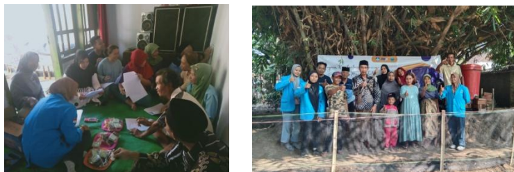
Gambar 4. Pengenalan dan pelatihan pengelolaan limbah cair tahu melalui grey water system

Kegiatan sosialisasi bahaya limbah dan pengelolaan limbah cair tahu dilaksanakan setelah tong filtrasi dan kolam biofilter sudah selesai dibuat. Kegiatan sosialisasi ini bertujuan untuk menjelaskan kepada masyarakat mengenai dampak limbah yang tidak terkelola dengan baik pada lingkungan. Kegiatan dilaksanakan dengan metode ceramah dan diskusi interaktif. Pada saat sebelum dan sesudah sosialisasi, diberikan kuesioner untuk mengukur pemahaman masyarakat mitra tentang materi yang diberikan. Setelah dilakukan penyuluhan untuk memperkuat pengetahuan dan pemahaman mitra tentang dampak limbah, mitra ditunjukkan mengenai metode pengelolaan limbah dengan grey water system yang telah dibuat sebelumnya. Kegiatan penyuluhan dapat dilihat pada Gambar 4.