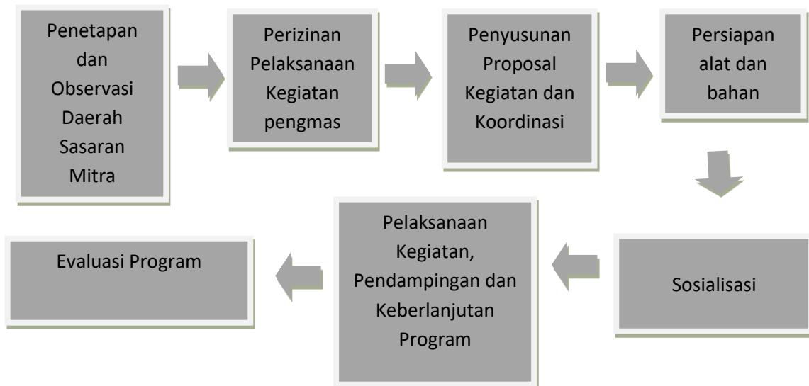
Gambar 1. Alur Tahapan Kegiatan Pengabdian kepada masyarakat

Berdasarkan Gambar 1 tahapan kegiatan yang dilakukan terdiri dari: